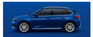
ENERGY BLUE UNI