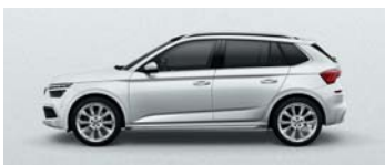
MOON WHITE METALLIC