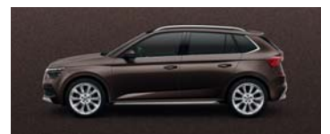
MAPLE BROWN METALLIC