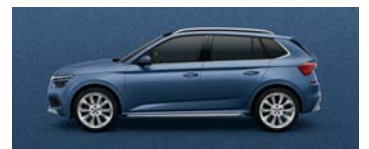
TITAN BLUE METALLIC