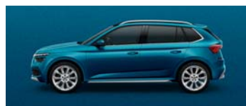
LAVA BLUE METALLIC