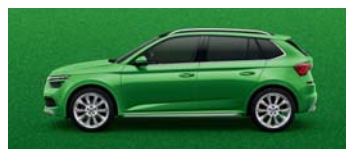
RALLYE GREEN METALLIC