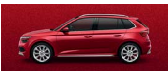
VELVET RED METALLIC