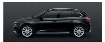
MAGIC BLACK METALLIC