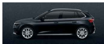
CRYSTAL BLACK METALLIC