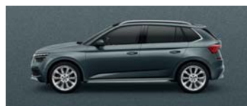
QUARTZ GREY METALLIC