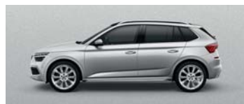
BRILLIANT SILVER METALLIC