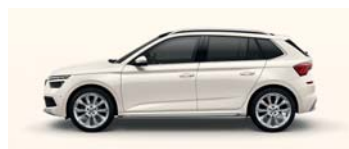
CANDY WHITE UNI