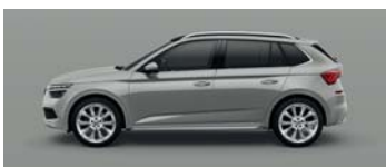
STEEL GREY UNI