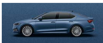
TITAN BLUE METALLIC