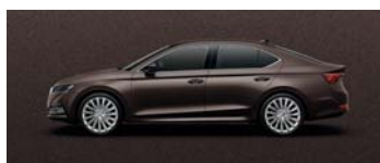
MAPLE BROWN METALLIC