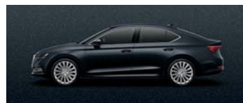
CRYSTAL BLACK METALLIC