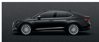
MAGIC BLACK METALLIC