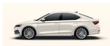
CANDY WHITE UNI