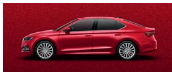
VELVET RED METALLIC