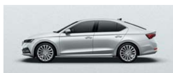
MOON WHITE METALLIC