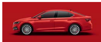
CORRIDA RED UNI