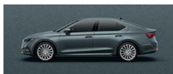
QUARTZ GREY METALLIC