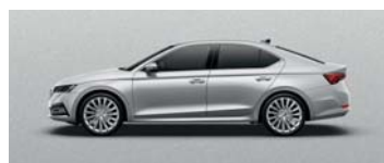
BRILLIANT SILVER METALLIC