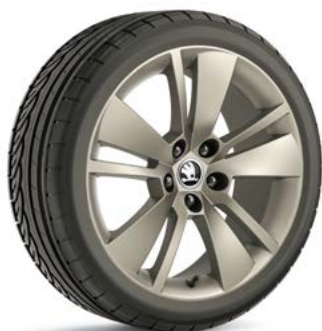
18" disky ZENITH z ľahkej zliatiny – platinové základná výbava

Interiér je vybavený športovými sedadlami, ktoré sú čalúnené čiernou farbou, charakter a atmosféru vozidla v interiéri dotvárajú svetelné efekty. Športový trojramenný volant je čalúnený perforovanou kožou so strieborným dekoratívnym obšitím.