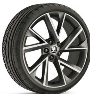
19" disky VEGA z ľahkej zliatiny – antracitové doplnková výbava