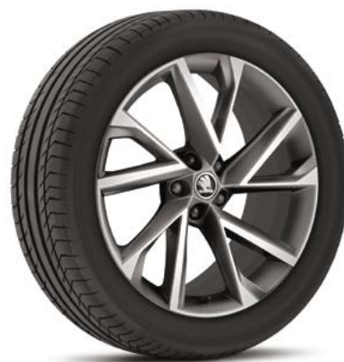
20" disky VEGA doplnková výbava