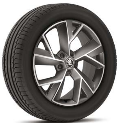
19" disky TRIGLAV z ľahkej zliatiny základná výbava

Všetky motory na splnenie limitov emisného predpisu EU6AG využívajú filter pevných častíc na zachytávanie a redukciu nespálených častíc.