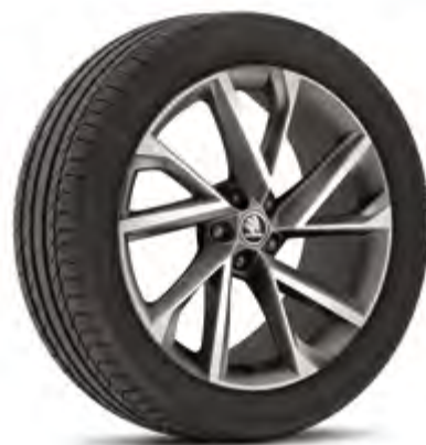
20" disky VEGA doplnková výbava