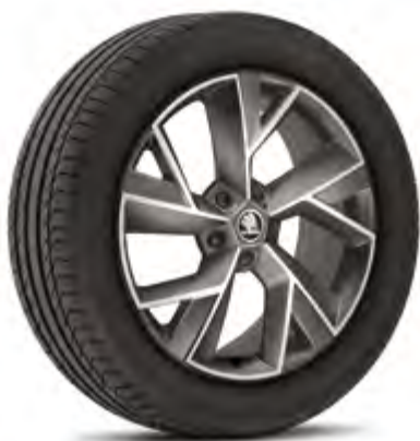
19" disky TRIGLAV z ľahkej zliatiny základná výbava

Všetky motory na splnenie limitov emisného predpisu EU6AG využívajú filter pevných častíc na zachytávanie a redukciu nespálených častíc.