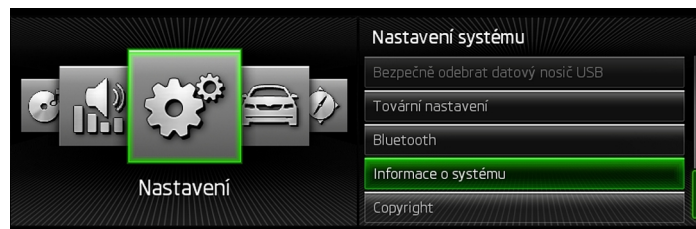
Obr. 1 Menu / Nastavenia