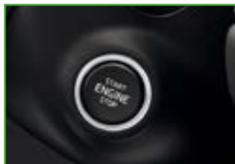
KESSEY FULL bezkluczkowy system obsługi samochodu