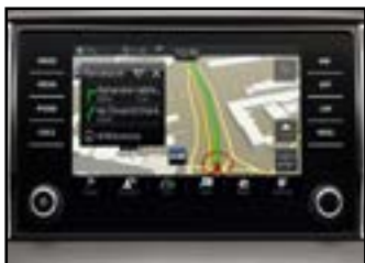
System nawigacji satelitarnej AMUNDSEN 8"