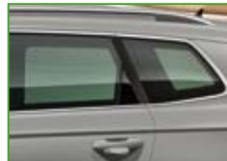
SUNSET tylne szyby boczne i szyba pokrywy bagażnika o wyższym stopniu przyciemnienia