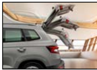
Elektrycznie sterowana pokrywa bagażnika