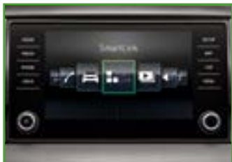
RADIO BOLERO (kolorowy ekran dotykowy 8", 2x USB-C, obsługa głosowa)