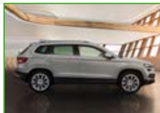
Czujniki parkowania z przodu i z tyłu