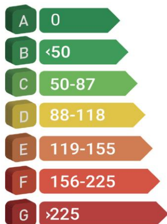
CO 2 -skala