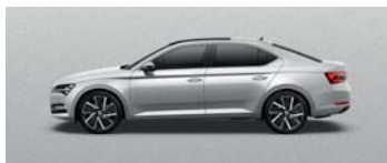
BRILLIANT SILVER METALLIC