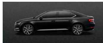
MAGIC BLACK METALLIC