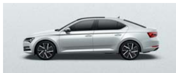
MOON WHITE METALLIC