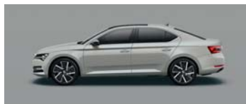
STEEL GREY UNI