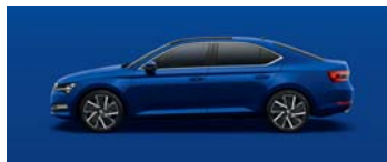
ENERGY BLUE UNI