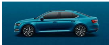
LAVA BLUE METALLIC