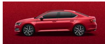
VELVET RED METALLIC