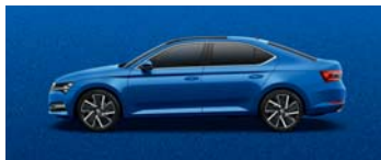
RACE BLUE METALLIC