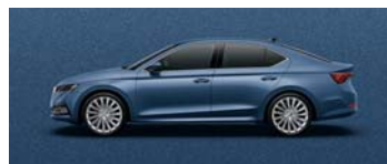
TITAN BLUE METALLIC