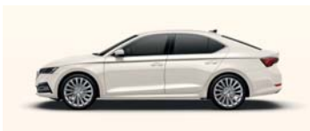
CANDY WHITE UNI