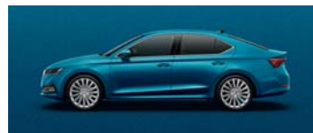
LAVA BLUE METALLIC