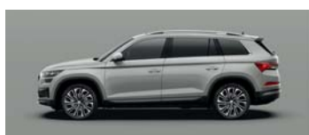
STEEL GREY UNI