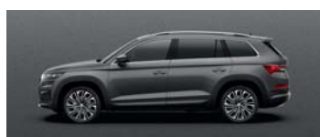
GRAPHITE GREY METALLIC