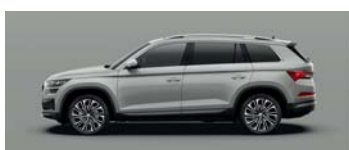
STEEL GREY UNI