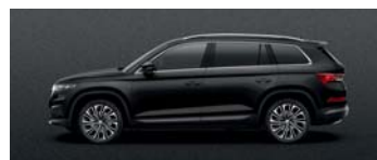
MAGIC BLACK METALLIC