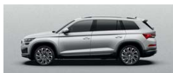
BRILLIANT SILVER METALLIC