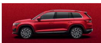
VELVET RED METALLIC