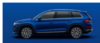
ENERGY BLUE UNI