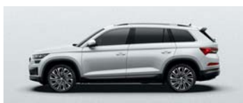
MOON WHITE METALLIC