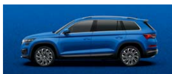
RACE BLUE METALLIC