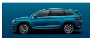
LAVA BLUE METALLIC