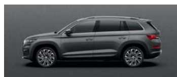
GRAPHITE GREY METALLIC