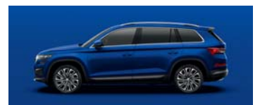
ENERGY BLUE UNI