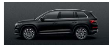
MAGIC BLACK METALLIC