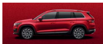
VELVET RED METALLIC