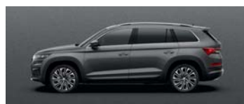
GRAPHITE GREY METALLIC