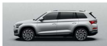
BRILLIANT SILVER METALLIC