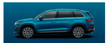
LAVA BLUE METALLIC