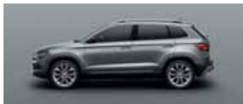
BUSINESS GREY METALLIC