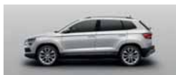
BRILLIANT SILVER METALLIC