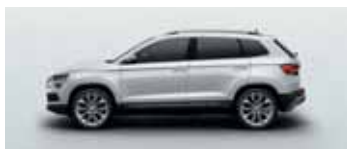
MOON WHITE METALLIC