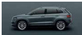
QUARTZ GREY METALLIC