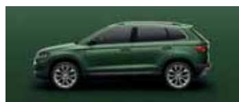
EMERALD GREEN METALLIC