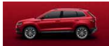
VELVET RED METALLIC