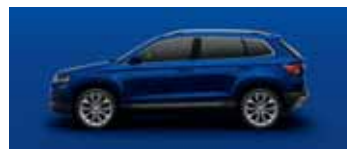
ENERGY BLUE UNI