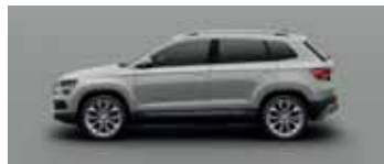
STEEL GREY UNI