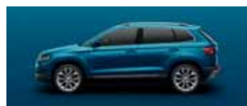
LAVA BLUE METALLIC