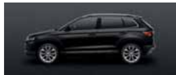
MAGIC BLACK METALLIC