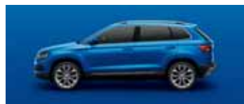
RACE BLUE METALLIC