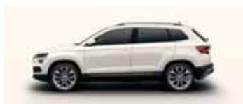
CANDY WHITE UNI