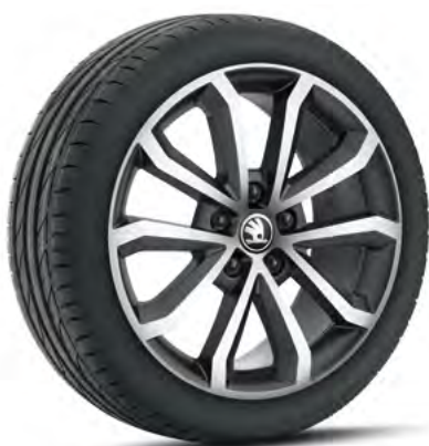
17" disky HAWK z ľahkej zliatiny základná výbava