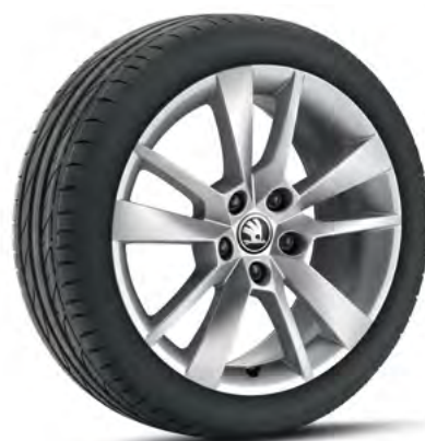
17" disky TRIUS z ľahkej zliatiny doplňková výbava