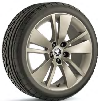
18" disky ZENITH z ľahkej zliatiny – platinové základná výbava