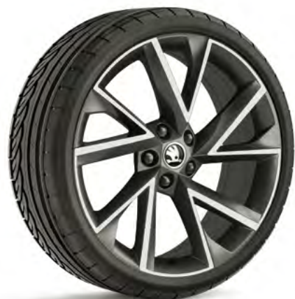
19" disky VEGA z ľahkej zliatiny – antracitové doplnková výbava